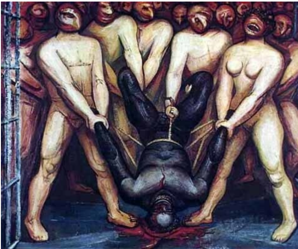
Caín en los Estados Unidos