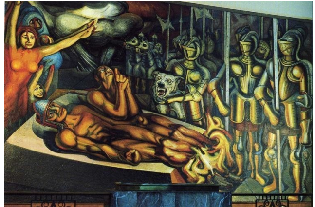
El tormento de Cuauhtémoc