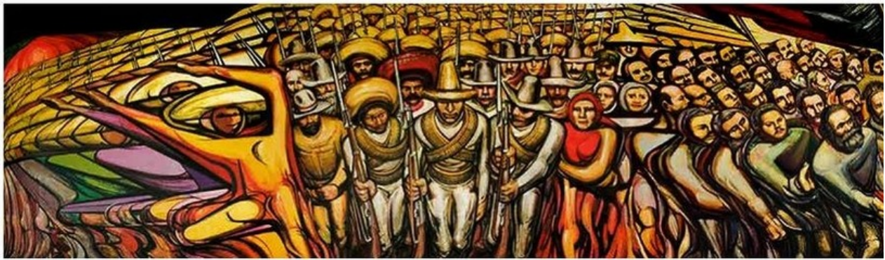
Del Porfirismo a la Revolución